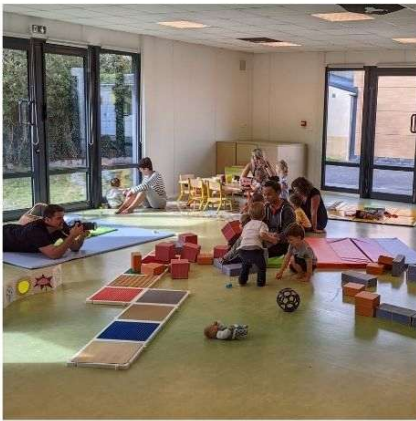
PETITE ENFANCE 0 à 3 ans