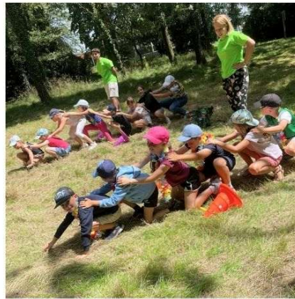
ENFANCE 3 à 11 ans