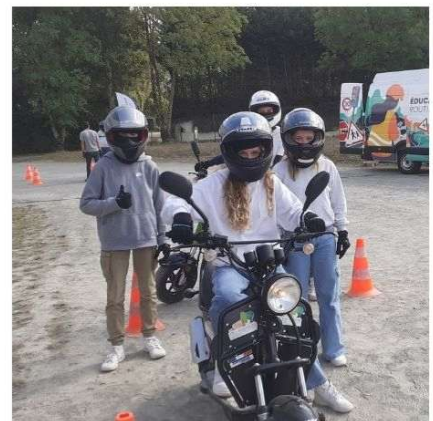
JEUNESSE 11 à 17 ans