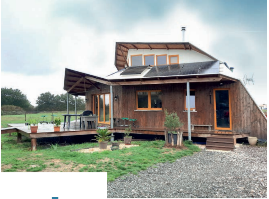
Maison autonome, La Chapelle-Palluau